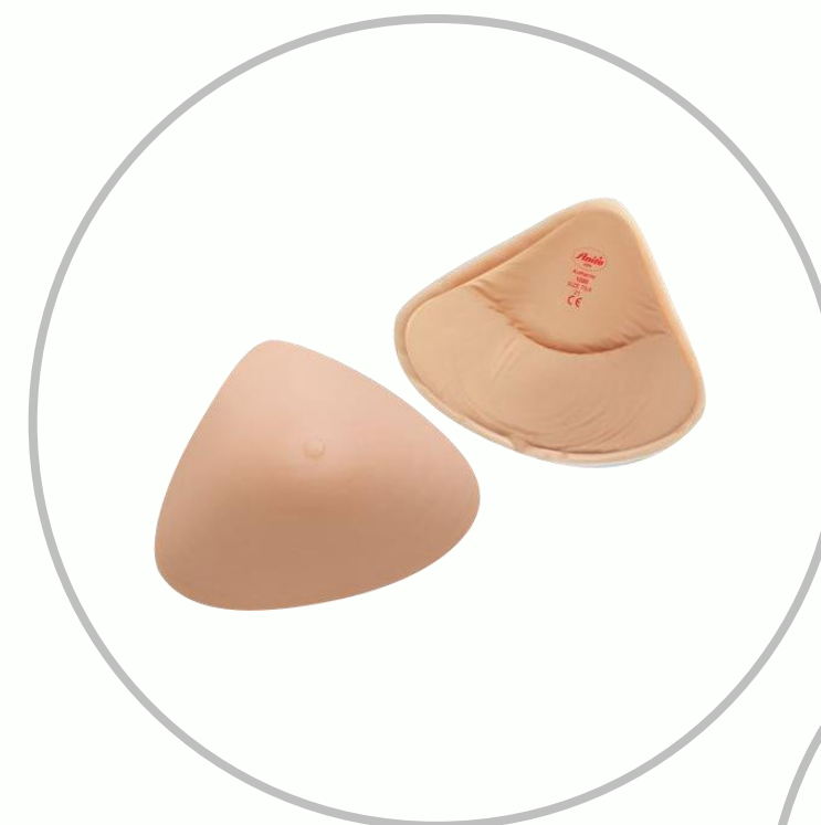
Протези молочної залози